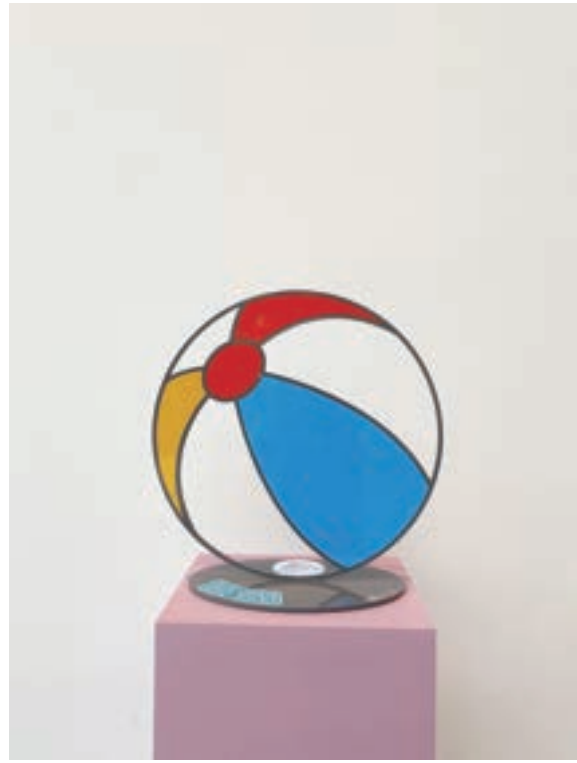
비치볼 (Beach ball) 40.6×20×41.5cm, steel, 자동차 페인트, 2021, 1/5