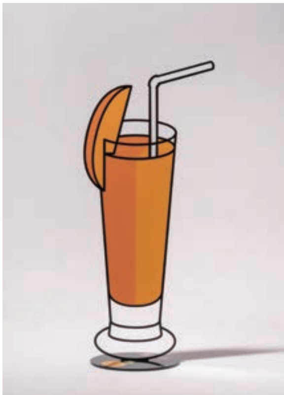
망고 셰이크 (Mango shake)

이번 전시에 선보이는 작품은 작가의 추억과 향수를 담은 두 가지 시리즈로 구분이 된다. 첫번째는 보라카이 망고 셰이크, 태국 비치의 풀문파티 슬리퍼, 비치볼, 소다 등 여행을 기억하고 추억하는 소재를 모티브로 작업을 했다. 두번째는 현재 주변에서 보기 힘들어진 작가의 어린시절 향수를 자극하는 반지사탕, 필름, 공중전화기등을 소재로한 시리즈이다.