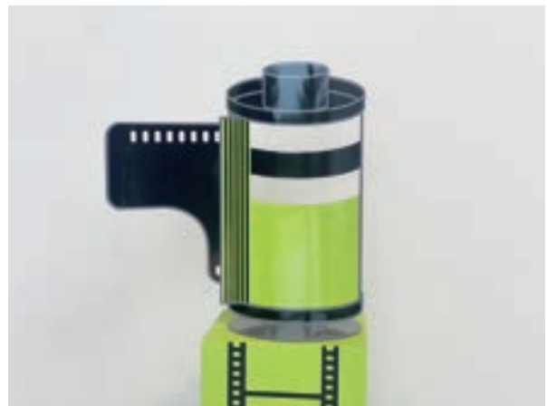
필름 (Film) 49×22×51cm, steel, 자동차 페인트, 2021, 1/10