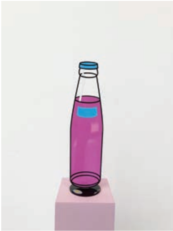
소다 (Soda) 16×15×61cm, steel, 자동차 페인트, 2021, 1/10